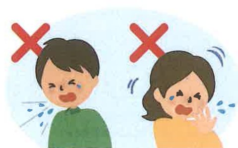
何もせずに咳やくしゃみをする 咳やくしゃみを手でおさえる