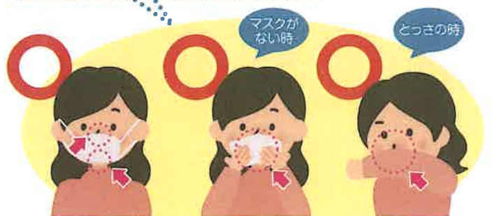
マスクを着用する (口・鼻を覆う) ティッシュ・ハンカチで口・鼻を覆う 袖で口・鼻を覆う