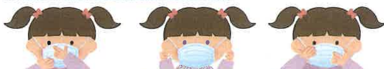
1 鼻と口の両方を確実に覆う 2 ゴムひもを耳にかける 3 隙間がないよう鼻まで覆う